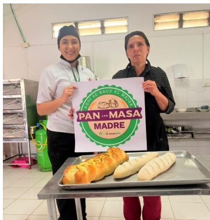
Foto 3. Foto final con el sello.