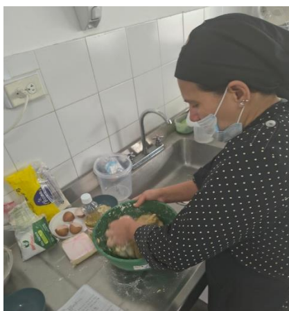
Foto 2. Elaboración y amasado de pan.